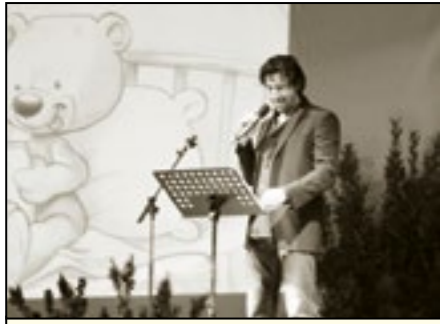
Walter Nudo attore

autore della pubblicazione "Lino e il diabete". Non sono mancati momenti spettacolari come la speciale partecipazione dell'attore Walter Nudo che, dopo aver presentato Lino leggendo brani dal suo libro, ha premiato i bambini vincitori del Concorso #BUON COMPLEANNO LINO, un concorso di disegno rivolto ai minori, avente a tema la raffigurazione dell'orsetto di peluche in occasione proprio del suo primo compleanno.